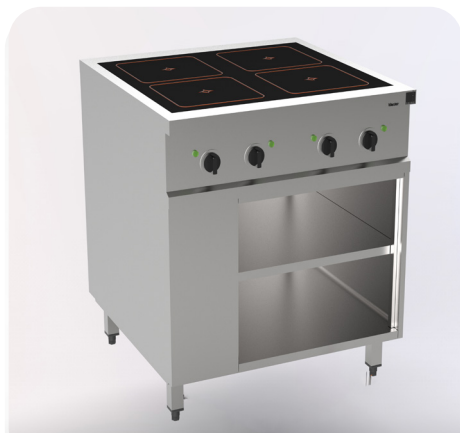
MH 200201 - Induktion 4x Rundspulen

Beispielhaft für höchste Ergonomie- und Hygieneansprüche sind flächenbündig eingesetzte Kochfelder sowie grosse, reinigungsfreundliche Radien im Unterbau. Als Option stehen zusätzliche Zargen als hygienischer Wandabschluss zur Verfügung.