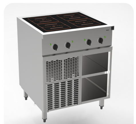
MH 200221 - Induktion 4x flächendeckend