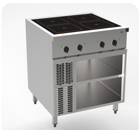
MH 200121 - Ceran mit Topferkennung