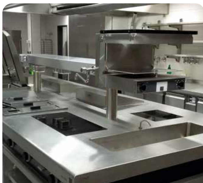
Salamandre- au-dessus du bain-marie