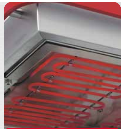
Corps de chauffe tubulaire (classic)