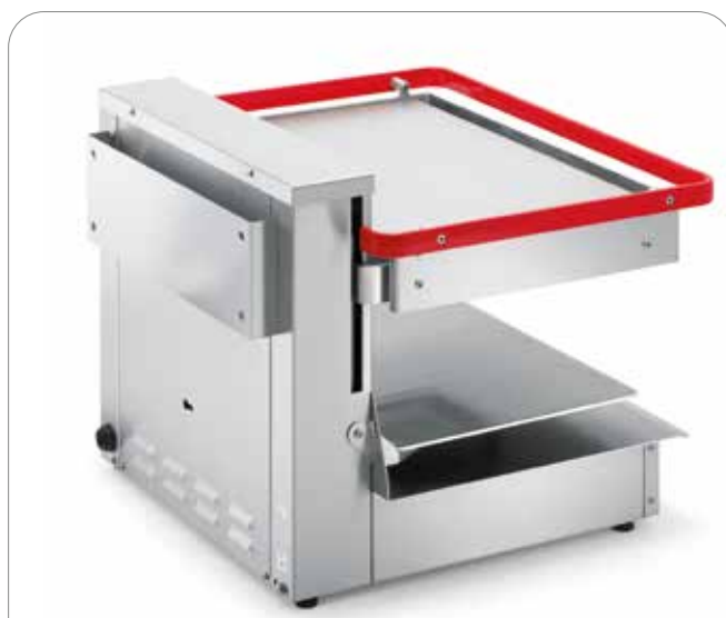
Support de montage mural à l'arrière