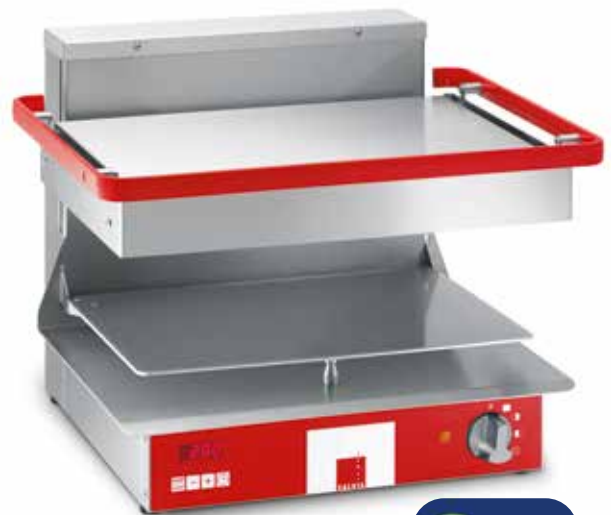
Salamandre Salvis Classic Pro