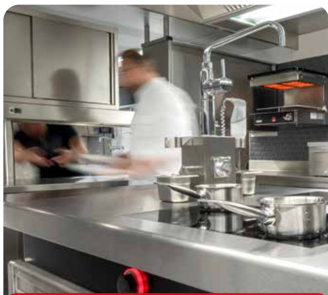
Salamandre murale Salvis Classic Pro près du passe