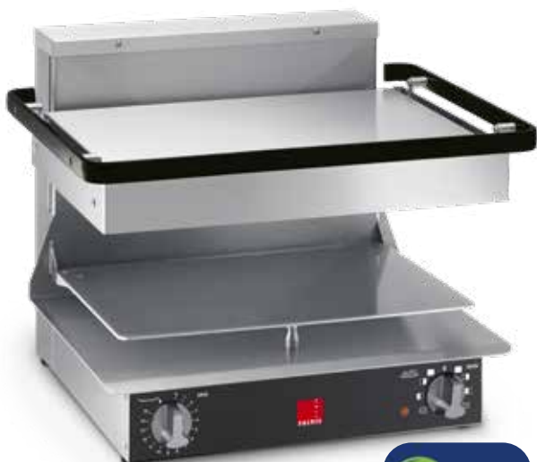
Salamandre Salvis Classic édition noir