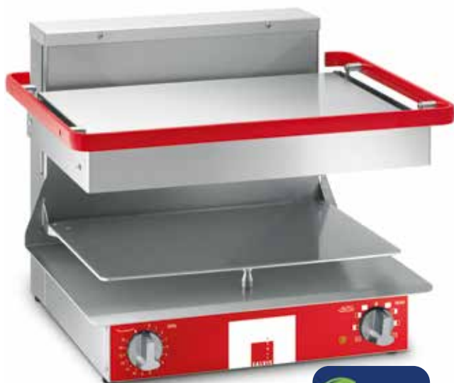
Salamandre Salvis Classic

Grâce à l'usinage de très haute qualité, aux larges rayons et au support d'assiette pouvant être relevé, le nettoyage s'avère aussi simple que rapide..