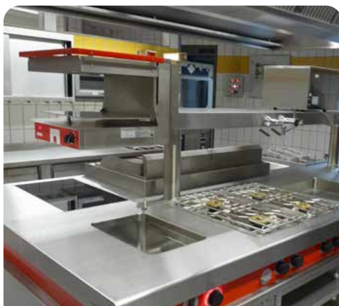
Salamandre au-dessus du fourneau