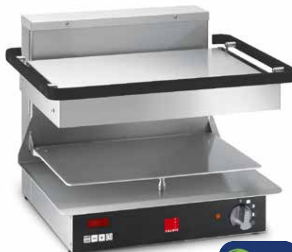
Salamandre Salvis Classic Pro édition noir