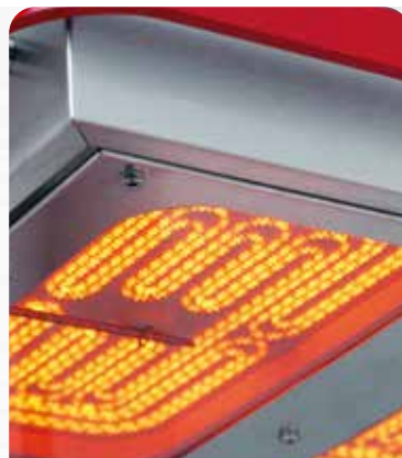
Corps de chauffe HiLight